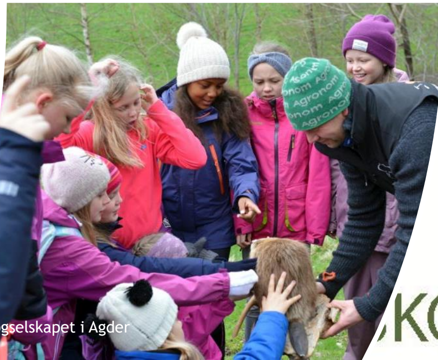
Skogselskapet i Agder