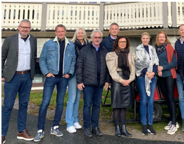
Næringsalliansen i Agder

– Det er fint å komme sammen på tvers av kommunegren