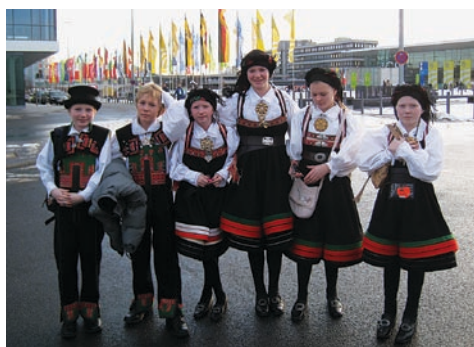
Nokre av dei unge folkemusikkutøvarane våre som deltok på CMT -Stuttgart.