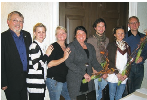
ArtStart - stipendier 2008. I alt 6 av 13 stipend delt ut i Agder gjekk til natur- og kulturbaserte etablerarar frå Setesdal.

Gjennom året er det arbeidd ein del for å formidle aktuelle kandidatar til nye satsingar – som ArtStart i regi av Innovasjon Norge. Det er og handsama fleire søknader om stønad til natur- og kulturbaserte etableringar og tiltak. Ikkje minst er det gitt støtte til fleire profesjonelle utøvarar som er synlege kulturberarar utover landsdelen og gjerne utanfor landegrensene.