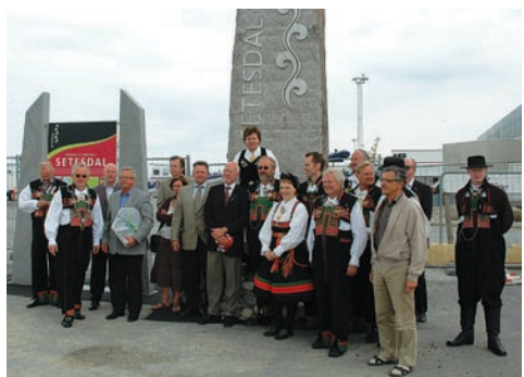
Avdukinga i Hirtshals fann stad 18.juni 08 – med inviterte gjester, kulturelt program og snor-samanbinding for å symbolisere bandet mellom Danmark og Noreg.

Det eine gjekk ut på setje opp master med banner langs riksveg 9 ved kommunedelsentra og viktige attraksjonar. Det andre galdt reising av merkestein ved terminalen til ColorLine i Hirtshals. Båe tiltaka fekk mykje positiv merksemd.