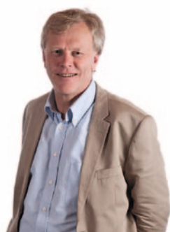
ARILD EIELSEN FYLKESRÅDMANN AUST-AGDER FYLKESKOMMUNE