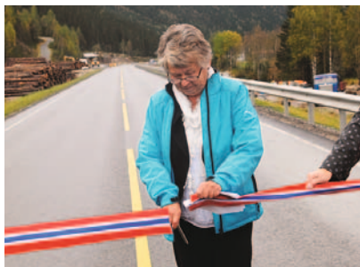
Parsellen Ose Nord – Tveit vart opna av fylkesordførar Laila Øygarden 22. sept. 2011.