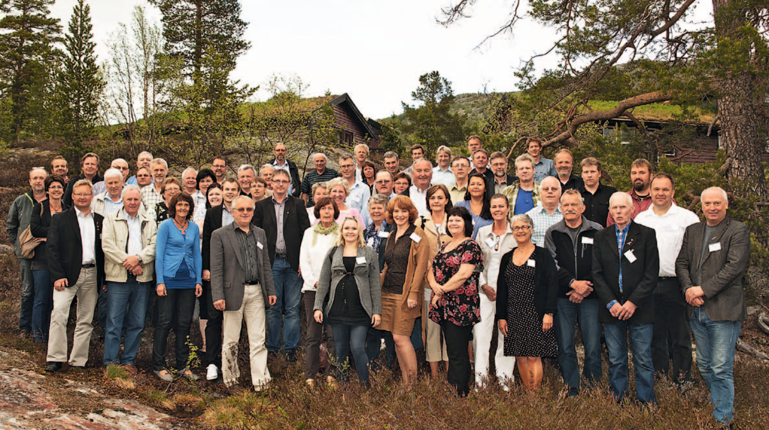
Setesdalstinget på Hovden 8-9. juni 2011.