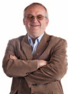
BJØRN ROPSTAD ORDFØRAR EVJE OG HORNNES KOMMUNE