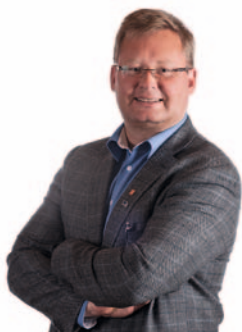
BJØRGULV SVERDRUP LUND FYLKESORDFØRER AUST-AGDER FYLKESKOMMUNE