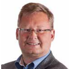
BJØRGULV SVERDRUP LUND Fylkesordfører Aust-Agder Fylkeskommune