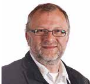
LEIV RYGG Ordfører Bygland kommune