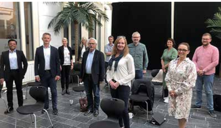
Næringsalliansen i Agder

I 2020 gjekk verksemda MORROW ut og inviterte aktørar på Agder til å levere tomteforslag til sin planlagde batterifabrikk. I regionen vår peika eit område på Syrtveit i Evje og Hornnes kommune seg ut, og Setesdal interkommunalt politisk råd leverte inn tomteforslag. Vårt alternativ nådde ikkje opp i konkurransen, men det var likevel ein nyttig prosess for Setesdal IPR både med omsyn til godt samarbeid og verdifull erfaring.