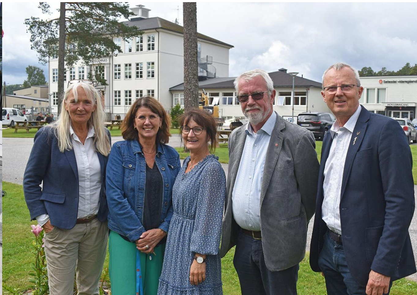
Frå Setesdølen, 25. august